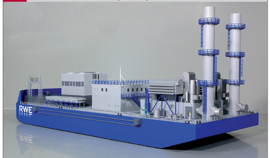
Abb. 1 Modell eines Kraftwerksschiffes

sich die OTEC-Schiffe noch in der Testphase und sind gegenwärtig noch nicht im kommerziellen Einsatz.